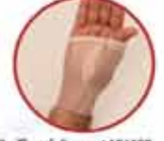
Thumb Support MV 190