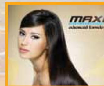
Maxi Gold Keratin