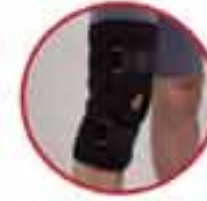
Hinged Knee Support MV 240