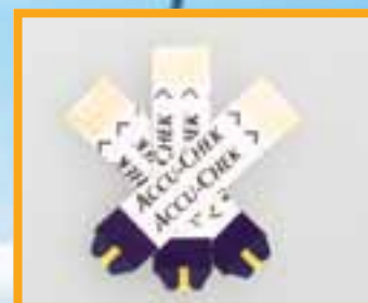
شرائط سكر Accu Chek