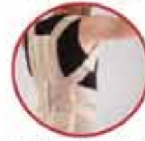
Thoracolumbar Support MV 120