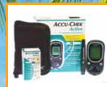
Accu Chek Active