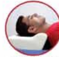
Cervical Pillow MV 280