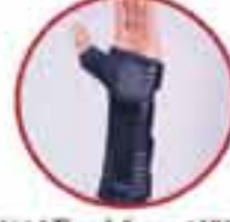
Wrist & Thumb Support MV 210