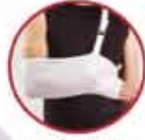
Arm Sling MV 160