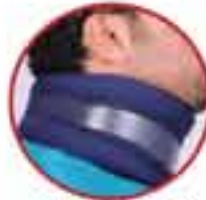
Move Collar MV 140