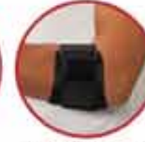
Tennis Elbow MV 220