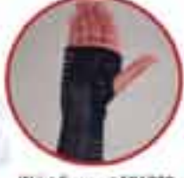
Wrist Support MV 200