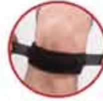
Patella Strap MV 230