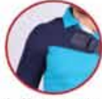
Shoulder Support MV 170