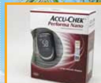
Accu Chek Performa