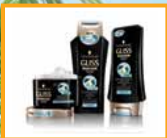
Gliss Shampoo & Conditioner