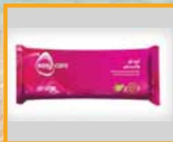
Easy Care Wet Wipes