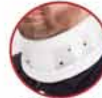
Rigid Collar MV 270