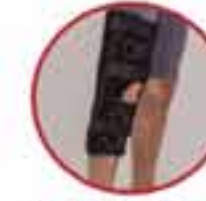
Knee Immobilizer MV 250