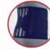
Lumbosacral Support MV 100